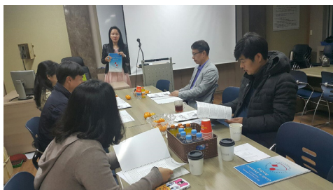
그림 3. 영어 다독 연구를 위한 교사커뮤니티

영어 다독에 대한 중등 교사들의 관심을 바탕으로 한 자발적 연구 모임은 교육청 및 학교 단위에서도 활발히 이루어지고 있다. [그림 3]은 D 광역시 G고등학교 영어 교사들이 만든 '영어 다독 연구를 위한 교사커뮤니티'이다. 본 연구자가 방문하여 영어 다독의 이론과 타 지역의 우수 사례를 공유하고 있다. 특히 세계다독학회(ER foundation: Extensive Reading foundation)와 한국 영어다독학회(KEERA: Korean English Extensive Reading Association)에서 발간한 영어 다독 매뉴얼을 무료로 배부하며, 영어 다독에 대한 실천을 돕고 있다.