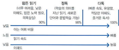
그림 1. 영어 읽기의 단계[10]

광범위하게 읽는 것으로 정의될 수 있다. 세계다독학회[9]와 한국영어다독학회[10]에서 정의한 독서의 수준(단계)은 [그림 1]과 같다.