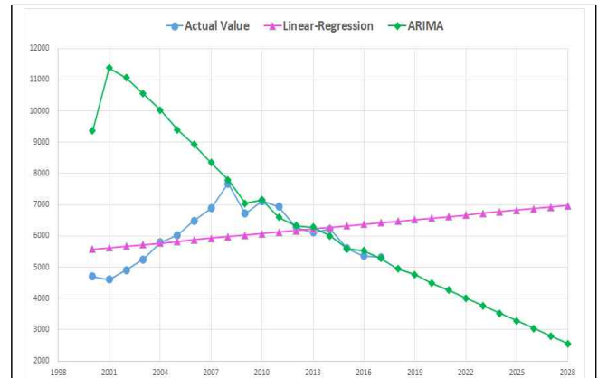
(a) Estimated with 18-years Time series Data (2000~2017)

Table 1과 2의 기초자료를 이용하여, Fig 1에서 제시한 개선된 도선사 수요산정 프로세스에 따라서 12개 도선구별에 대한 적정 도선사 수요를 추정하였다(Table 4 참조). 우선 Fig 2는 적정 최대도선시간을 초과하는 포항항 도선사 수요추정 과정을 상세히 보여주고 있다. 즉, Fig 2.(a)는 Table 2에서 제시한 최근 18년간의 실도선척수에 대한 시계열 자료를 활용하여, 단순선형회귀분석과 ARIMA분석법으로 추정한 결과이다. 먼저, 포항항의 항만 화물처리 실적은 2008년 67,658 천 RT(Revenue Ton)에서 2017년 58,890천RT으로, 그리고 입출항선박 척수도 마찬가지로 2008년 20,453척에서 2017년 12,908척으로 감소하는 추이를 보이고 있다(KMI, 2019). 따라서 Fig. 2 (a)와 같이, 실도선척수 또한, 2008년까지 7,679척으로 증가하다가 이후 2017년에는 5,321척까지 감소하는 같은 추세를 보임에 따라 실도선척수는 항만물동량과 입출항 선박 변화를 대변할 수 있는 변수임을 확인할 수 있다.