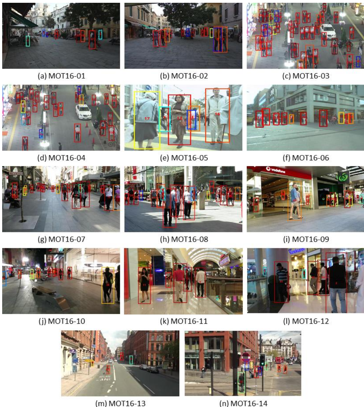
Fig. 3. (a)–(n) Tracking results using the proposed model on the 2016 MOT Challenge dataset.

향후 연구로서, 제안된 appearance 모델의 외형 구별 성능을 향상하기 위해 푸리에 이미지의 노이즈 제거 기법을 적용할 예정이며, 주파수 성분의 특징을 이용하여 다중 객체 추적에서 CNN연산의 계산 효율성을 향상시키는 연구를 진행할 예정이다.