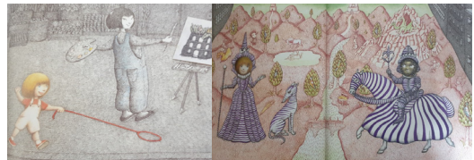
그림 4. 『마들렌카의 개』의 상상친구 그림표현