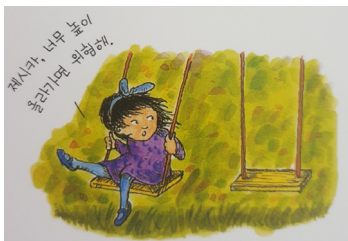
그림 5. 『내 친구 제시카』의 빈 여백 표현

상상친구의 현시 여부에 대한 글표현으로는 ‘소찰풍이는 롤라가 상상 속에서 만든 친구라서 롤라 눈에만 보여요(진짜야 내가 안그랬어), ‘제시카는 도대체 어디 있니?’(내 친구 제시카), ‘어른들은 토미가 있는지 몰랐어’(내 비밀친구 토미) 등과 같이 타인에게 보이지 않음을 보여주고 있다. 그림 표현에서도 상상친구가 유아에게만 보이고 다른 사람에게는 보이지 않는 존재라는 것을 나타내기 위해 상상친구를 그리지 않고 빈 여백으로 표현하거나(그림 5) 흑백이나 투명선(그림 6)으로 표현되고 있었다.