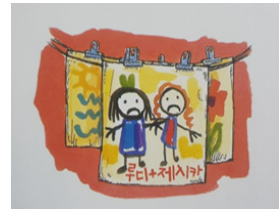
그림 2. 『내 친구 제시카』의 그림 속 상상친구

단말야에서는 책의 앞부분에서는 계속 상상친구가 여백의 형태로 비어 있다가 마지막 장면에 실재하는 모습으로 한 번 등장한다. 이를 통해 눈에 보이지 않는 상상친구가 영유아들에게는 뚜렷이 존재하며 그들에게 생생하게 나타내 보여지고 있다는 것을 그림책에서 반영하고 있음을 알 수 있다.