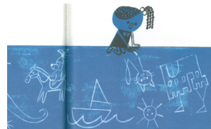
그림 3. 『나의 유령친구 레오』의 그림 속 상상친구