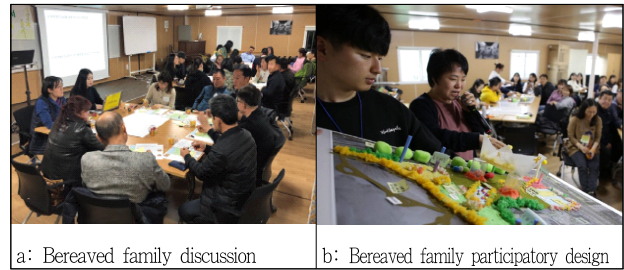
Figure 2. Design Guideline Workshops

임을 되새기는 공간, 참사와 희생자를 추모하는 공간, 누구나 편히 즐겨 찾는 문화공간, 거부감 없는 시민 친화공간, 안전과 생명존중을 배우는 공간, 청소년들이 자유롭게 이용하는 공간, 치유와 화합의 공간, 가족과 다양한 사람들의 휴식 공간, 인지도와 명성 있는 랜드마크, 자연친화적이고 개방적인 공간, 희망과 미래를 꿈꾸는 공간이다(4·16 Ansan Citizens Solidarity, 2019). “담론은 정책의 질적 수준을 높이는 것뿐만 아니라, 지역사회 분위기 전환에도 기여한다(Park, 2009).”고 했다. Figure 2와 같이 참여형 워크숍을 통한 담론형성 과정은 개인적으로 생각들을 주변사람들과 공감하게 되고, 주민들은 사회 이슈에 직접 참여하면서 함께 고민하고 이용할 수 있는 방안을 도출하게 되었다. 이 과정은 다른 의견을 경청할 수 있는 수용성을 높이고, 다양한 시각적 이해력을 증대시켰다. 또한 사회적 갈등 문제해결을 위한 기량을 높일 수 있는 기반이 만들어졌다. 시민지침서 마련 워크숍 결과, 8개의 추모공원 설계전략을 도출했다. 7) 그리고 Table 1은 봉안시설, 전시관, 문화공간 등의 실내공간과 기념시설, 활동공간, 휴게시설 등의 실외공간을 구분하여 워크숍을 통해 제안된 각각의 역할 및 형태에 대해 정리한 내용이다. 건물 중심의 내부공간과 조경중심의 외부공간으로 구분하여 5개의 주요 특징별로 구현되었으면 공간기능, 프로그램, 형태, 디자인 등에 대한 의견들을 정리했다.