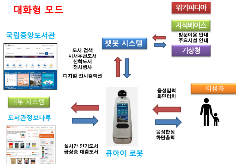
〈그림 1〉 대화형 검색의 작동 방식

터치 또는 음성입력)을 거치면서 도서관 이용정보(시설 안내, 전시·행사 안내) 및 도서정보(신착 도서, 인기도서 등), 기타 정보(날씨정보 등) 등을 제공받을 수 있다(IBRICKS 컨소시엄, 2019a). 그리고 검색결과는 내장 모니터(텍스트) 또는 스피커(음성합성)를 통해 출력되며, 이용자는 이 과정을 반복하면서 보다 상세한 정보를 찾아 볼 수 있다.