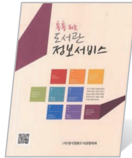
톡톡튀는 도서관 정보서비스 (2012)