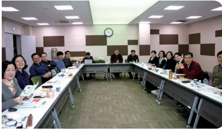
하반기 관리자세미나 (2018)