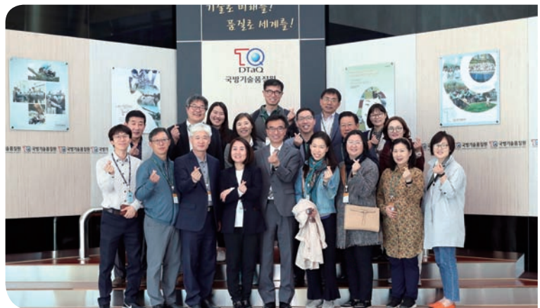
상반기 관리자세미나 (2018)