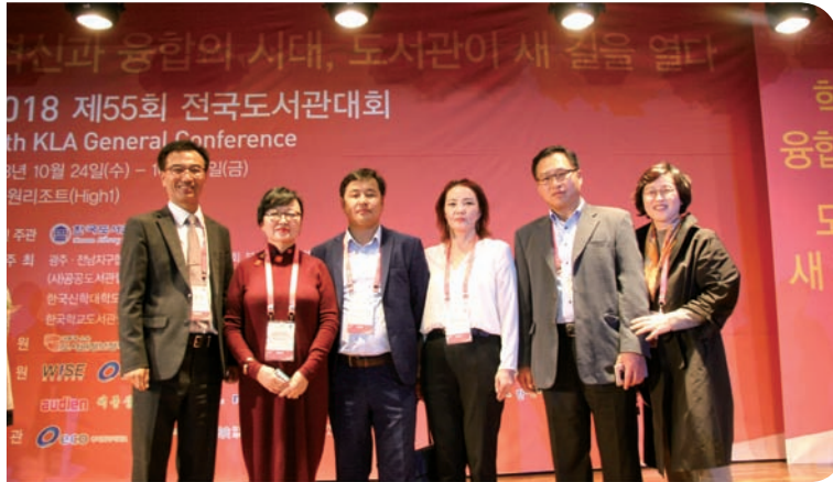
몽골도서관컨소시엄(협회) 대표단 KSLA 방문 (2018)