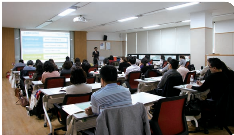
전문도서관운영핵심 교육 (2018)