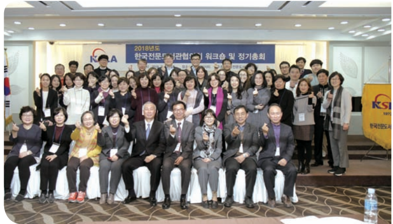
워크숍 및 정기총회 (2018)