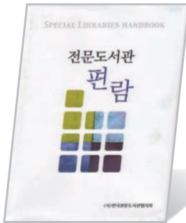
전문도서관 편람 (2011)