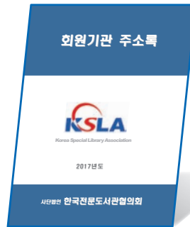
KSLA 회원기관 주소록(전자문서)(2017)