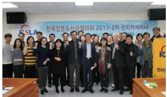
<제2017-2차 관리자세미나에서 KSLA 비전 논의>