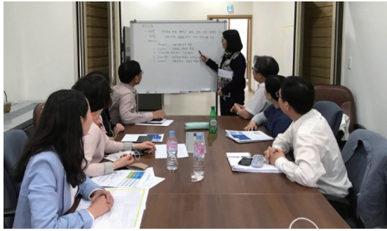
〈제3차 TF 회의, KSLA 비전 수립 논의〉