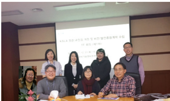
<제1차 TF회의, KISTI 회의실>