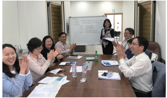
〈제3차 TF 회의에서 KSLA 비전 수립 최종안 만들다〉