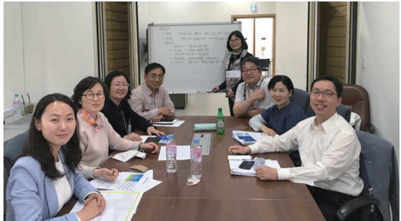
〈KSLA 비전 수립 TF〉

한국전문도서관협의회(Korea Special Library Association, KSLA)의 태동을 살펴보려면, 1972년과 1989년으로 거슬러 올라갑니다. 1972년에 과학기술분야의 정보서비스 협력을 위해 과학기술정보협의회(STIMA)가 설립되었고, 1989년에 인문사회·경제 분야의 정보서비스 협력을 위해 한국사회과학정보자료협의회(KIRSA)가 설립되었습니다. 각각의 위치에서 우리나라의 학술정보 관리 및 유통, 정보기술 선도, 기관간 정보공유, 정보서비스 협력 등 정보서비스 발전을 선도하였습니다.