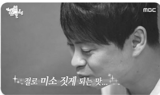
절로 미소 짓게 되는 맛, 오리고기