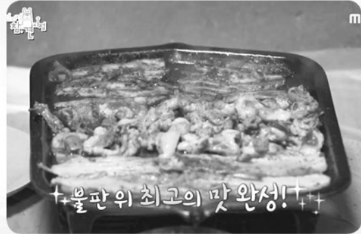
이영자: 진액이 나올 때 익은 김치와 더덕무침을 올려줍니다.