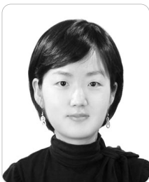
윤 소 윤

2000년대에 들어서면서 국내 뉴캐슬병 상황은 급격하게 변하고 있다. 가장 눈에 띄게 나타난 변화는 국내 양계 농장에서의 뉴캐슬병 발생 상황이다. 뉴캐슬병 백신 접종 의무화 이후(2000년대 초) 발생 추이를 보면 의무접종정책 초기에는 발생 건수가 크게 증가하였지만, 그 이후 2002년을 기점으로 지속적으로 뉴캐슬병 발생이 줄어들어 최근 8년간 뉴캐슬병의 발생이 없었기 때문에 뉴캐슬병이 완전히