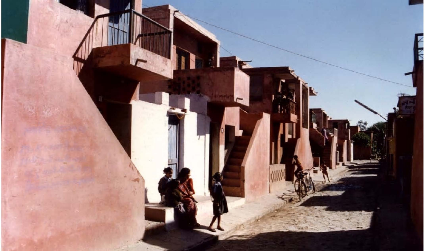
Aranya Low Cost Housing 1989 Indore, India

2018년 프리츠커 상 수상자인 발크리슈나 도시는 인도의 유구한 전통을 살린 건축과 도시 빈민들을 위한 집합주택 설계로 모범을 보였다. 사회와 인간에 기여하겠다는 책임감, 사회·경제·환경을 고려한 지속가능한 건축으로 공공성에서 높은 점수를 받았다.