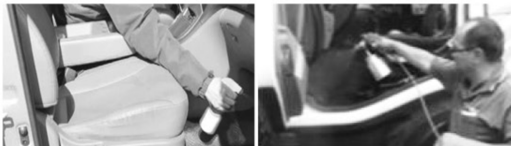
차량 내부 소독