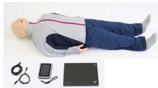
Fig. 2. Laerdal Resusci Anne Q CPR Manikin

본 실험을 진행하기 위하여 PC를 이용한 실습평가용 마네킨(Resusci® Anne SkillReporter™)을 이용하였다. 2분 동안 시행한 가슴압박의 평균을 통하여 가슴압박의 속도, 깊이, 평균 가슴압박과 이완의 비율의 데이터를 이용하였다.