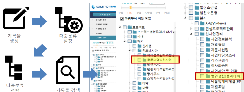
〈그림 2〉 다중분류체계 활용 현황

또한, 기능분류체계와 별도로 기관의 특성을 고려하여 다중분류체계를 사용할 수 있도록 설계하였다. 한국중부발전은 발전소 건설 및 운영, 사업개발 등에 관한 업무를 수행하기 때문에, 프로젝트별, 전문분야별로 업무담당자들이 원하는 분류의 활용에 대해 요구가 많았으며, 이러한 다중분류는 지식 관리 등에 활용될 예정이다.