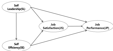
Fig. 1. Research Model

선행연구 결과를 기반으로 본연구에서는 연구자 대상으로 셀프리더십, 자기효능감, 직무만족, 직무성과 변수 간의 상관관계를 측정해보고자 Fig. 1과 같이 연구모형을 수립하였다.