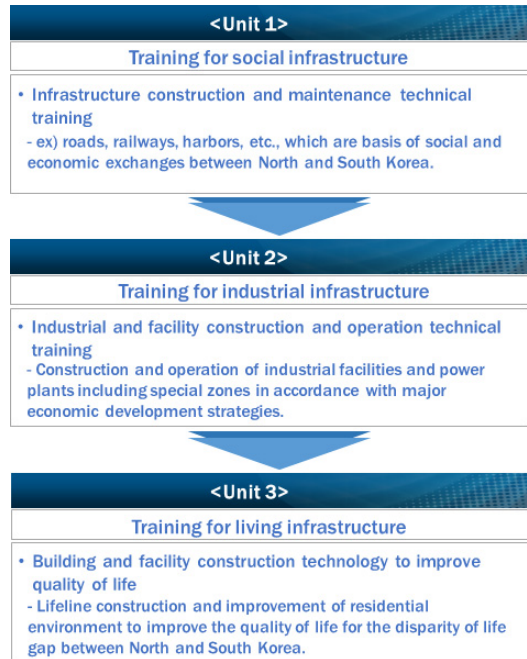
Fig. 2. Operating strategy of gradual training program

사회인프라 구축을 위한 건설기술인력의 양성은 특정 지역이 아닌 접경지역 전체에서 공통으로 나타나는 수요이며, 남북한의 정치·경제·사회·문화·환경의 모든 직간접적인 협력 및 교류를 위해 필수적으로 요구되는 기반시설의 정비와 관련된다. 여기에는 도로, 철도, 항만 등의 건설은 물론이고 점검 및 유지보수를 위한 전문 건설기능인력의 양성이 포함된다.