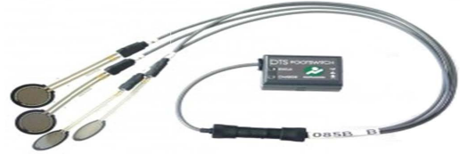
Fig. 1. Wireless footswitch (DTS FootSwitch, Noraxon Inc., USA)

보행 시 근피로 유발 전 · 후의 넙다리곧은근, 앞정강근, 장딴지근의 표면 근활성도를 측정하기 위하여 무선 표면 근전도(TeleMyo DTS, Noraxon Inc., USA)를 사용하였다. 피부 저항을 최소화하기 위하여 전극 부착 부위를 알코올로 닦아내고 접지전극과 전해질 젤이 도