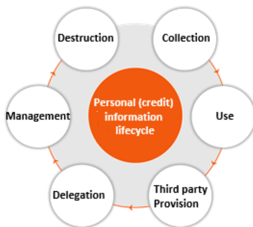
Fig. 1. Personal (credit) information lifecycle

영세수탁자가 가지는 보안위험을 도출하기 위하여 먼저 수탁자가 위탁자의 업무를 수행함에 있어 어떤 단계를 거치는지 확인할 필요가 있다. 이를 일반적으로 개인신용정보 라이프사이클로 구분되는데, 구체적인 내용은 Fig.1.과 같다.