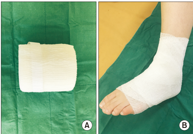
Figure 3. (A) 12 cm x 20 m size of elastic cohesive bandage. (B) Application of elastic cohesive bandage.