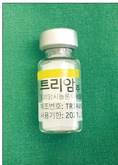
Figure 1. Triamcinolone acetonide (1 mL; 40 mg).

2016년 3월부터 2017년 6월까지 본원에서 족관절 외과 점액낭염으로 치료받은 55명의 환자 중, 당뇨병성 혹은 개방성 창상으로 인한 감염성 점액낭염으로 수술적 치료를 시행하였던 28명을 제외하고 1년 이상 경과 관찰이 가능하였던 27명의 연속된 환자를 대상으로 후향적 연구를 시행하였다. 모든 환자에서 1 mL (40 mg)의 TA (Kenalog; Bristol-Myers Squibb, Princeton, NJ, USA)를 외과 점액낭염에 주사하여 치료를 시행하였다(Fig. 1). 환자의 의무기록을