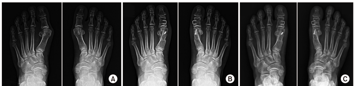
Figure 2. Preoperative (A), postoperative 4-month (B) and postoperative 12-month (C) follow-up weight bearing anteroposterior foot radiographs of 57-year-old female who underwent bilateral synchronous scarf surgery showed decrease of the hallux valgus and the first-second intermetatarsal angles after the surgery.