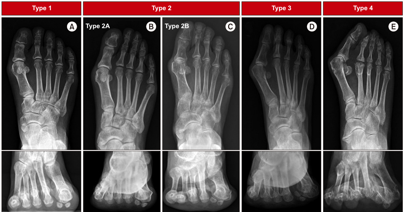
Figure 4. Radiologic findings of Triplane hallux valgus classification. (A) Radiographs showing class 1 hallux abducto valgus, with no rotation observed on the axial view. (B) Radiographs of class 2A hallux abducto valgus showing eversion of the first metatarsal and the sesamoid still in the groove with intact crista. (C) Radiographs of class 2B hallux abducto valgus showing rotation of the first metatarsal with subluxation of the sesamoid complex. (D) Radiographs of class 3 hallux abducto valgus associated with metatarsus adductus, with no first metatarsal frontal/coronal plane rotation seen on sesamoid axial view. (E) Radiographs of class 4 hallux abducto valgus showing arthrosis of the first metatarsal phalangeal sesamoid complex.

또한 분류에 따라 중족골 외회전이 있는 class 2에서는 3차원적 변형을 교정할 수 있는 절골술을 권고하였으며 종자골 이탈구가 없는 가상 종자골 탈구인 class 2A에서는 과도한 원위 연부조직 유리술을 하지 않을 것을 권고했다(Table 1).