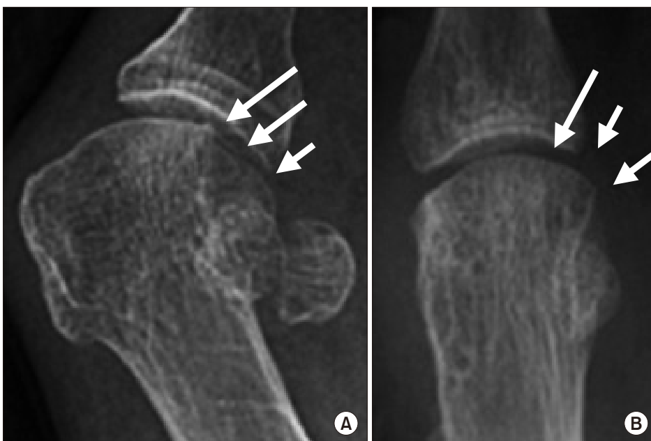
Figure 3. Radiographs illustrating for the shape of the lateral edge of the first metatarsal head. (A) In case of metatarsal external rotation, the shape of lateral edge is a round shape (arrows). (B) When there is no metatarsal rotation, the shape of lateral edge had an angular shape (arrows).

최근 무지 외반증의 관상면에서의 회전변형에 대한 연구가 이루어지면서 Hatch 등 5) 은 이에 대한 분류를 제시했다. 기존의 무지 외반각 및 중족골간 각으로 무지 외반증을 진단 후 족부 전후방 방사선사진 및 체중부하 종자골 방사선사진(weight bearing sesamoid axial view)을 통해 중족골의 외회전 및 종자골의 아탈구 여부를 분류의 기준으로 삼았다. 이에 따라 중족골이 외회전되지 않은 class 1과 중족골의 외회전이 관찰되는 class 2로 분류하였으며 class 2는 다시 종자골의 아탈구 여부에 따라 class 2A와 class 2B로 세분화했다. 중족골 내전각이 20도 이상인 경우를 class 3, 중족지관절의 퇴행성 변화가 있는 환자는 class 4로 분류했다(Fig. 4).