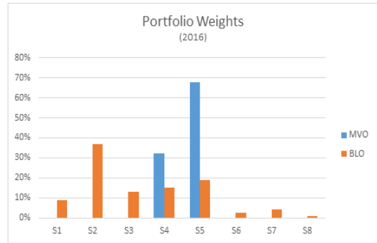
<Figure 3> Portfolio Weights Comparison(2016)

각각의 로보어드바이저 알고리즘 별 구체적인 자산배분 결과는 다음 <Table 2>와 같다. 2016년 뿐만 아니라 다른 연도에서도 최적 자산배분의 결과는 비슷한 양상을 보여주고 있다.