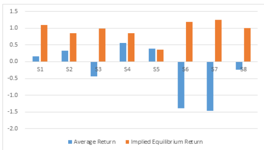
<Figure 2> Implied Equilibrium Return vs Average Return

2008년부터 2015년까지의 학습용 데이터에서 각 섹터지수별 공분산과 시장포트폴리오의 시가총액 비율을 계산하고, 평균수익률과 표준편차를 계산하여 평균분산모형과의 성과를 비교한다. 내재균형수익률 산출을 위한 추가 입력변수인 위험회피계수 \lambda 는 여러 연구에서 적용하고 있는 3을 사용한다(Drobetz, 2001; Dimson, 2003; Idzorek, 2005). 각 섹터지수별로 산출된 내재균형수익률과 평균분산모형의 입력변수인 평균수익률은 다음 <Figure 2>와 같다.