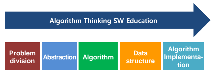
Figure 2: Algorithm Thinking Software Education

다양한 영역에서 알고리즘적 문제해결을 경험하도록 교육 과정을 설계하여 확산적 사고를 발전시키고자 한다.