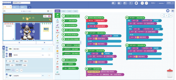
(Fig. 3) Modify the program

넷째, 프로그램 수정하기에서는 (Fig. 3)과 같이 주어진 소스 프로그램을 수정하여 자신이 찍은 대상물을 엔트리 프로그램에 추가하는 활동을 하였다. 본 연구는 프로그래밍 기술을 익히는 것이 주요 목적이 아니므로, 완성된 프로그램 소스를 주고, 각각의 기능을 상세하게 설명하였으며, 촬영된 사진을 추가하는 방법을 알려주는 등 될 수 있는 대로 묘사적 글쓰기 활동에 더 많은 시간을 할애할 수 있도록 안내하였다.