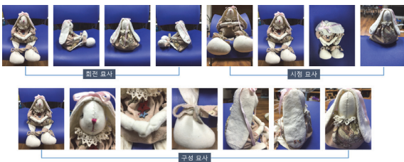
(Fig. 2) Take a picture of the object

셋째, 대상물 사진 찍기에서는 (Fig. 2)과 같이 묘사할 대상물을 앞쪽, 왼쪽, 오른쪽, 뒤쪽, 아래쪽, 정면, 위쪽, 뒤쪽 등 다양한 방향(시선)에서 대상물의 사진을 촬영하도록 하였고, 대상물의 일부분을 확대하여 촬영하도록 하여, 상세하게 관찰할 수 있도록 하였다.