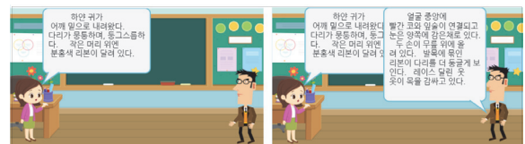
(Fig. 5) Display full text depicting the object

여섯째, 결과 화면 제출하기에서는 묘사하는 글을 모두 입력 후에 '확인' 버튼을 클릭하면 나타나는 화면을 확인하고, 그것을 캡처하여 제출하도록 하였다. 최종 실행 화면에서는 (Fig. 5)와 같이 묘사한 글을 한꺼번에 보여주고, TTS(Text to Speech) 엔진을 활용하여 글을 읽어주도록 하였다. 자신이 직접 쓴 글을 들어보고, 전체적으로 묘사한 글의 분위기가 적절한지를 살펴보도록 하였다.