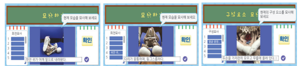
(Fig. 4) Screen captures of the program

다섯째, 묘사적 글쓰기에서는 자신이 만든 사진을 추가하여 만든 프로그램을 실행하면서, 대상물을 묘사하는 글을 쓰도록 하였다. (Fig. 4)와 같이 화살표 방향키를 누를 때마다 이미지의 모습이 변경되고, 보이는 이미지를 상세하게 묘사하는 글을 입력하도록 하였다.