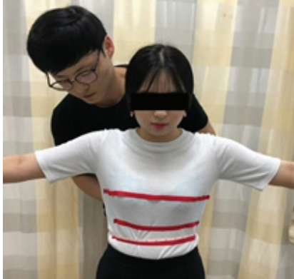
Fig. 1. Using a tape measure to measure the upper-, mid-, and lower thoracic mobility