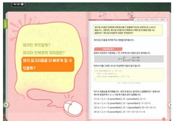
[그림 1] 온라인 소프트웨어 교육에서 e-Book의 개념학습 예시