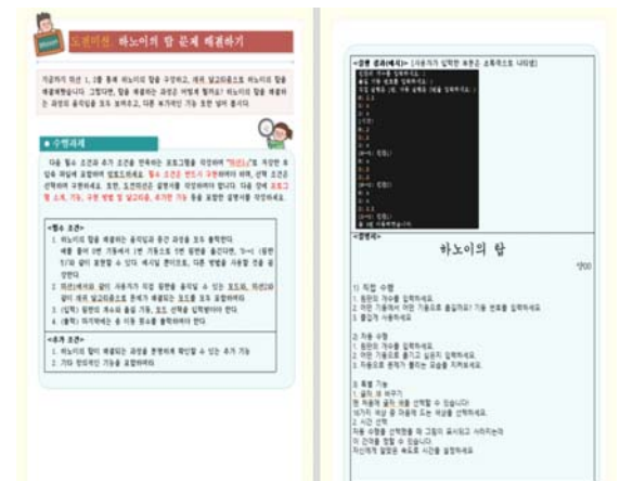
[그림 2] 온라인 소프트웨어 교육에서 탐구활동보고서의 제출본 예시