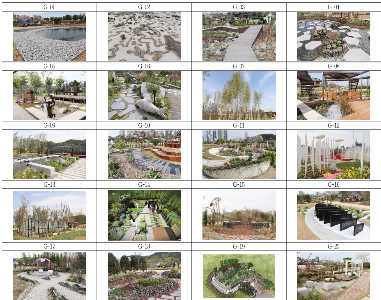
Table 2. A Images of Gardens at Taehwagang Garden Show

본 연구는 작가의 의도와 개념에 대한 연출 특성을 파악하기 위한 목적으로 '공간구성'과 '형태적 측면'에 한정하여, 각 작품