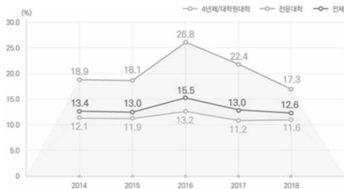
<그림 4> 2014~2018 전국 대학도서관의 재학생 대비 연간 이용교육 참가자수 비율 (한국교육학술정보원 2018)

학습윤리교육 지원의 내용은 학부생의 학습윤리 개념 습득을 위한 과제물 및 소논문 작성법 교육, 대학원생의 예비 연구자로서의 윤리의식 고취를 위한 학위논문작성법 교육 등의 프로그램을 운영하는 것이다. 대학별로 학습윤리교육과 관련된 과제는 도서관 이용교육에 포함하였으며, 이와 관련하여 2018년 대학도서관 통계조사 결과 도서관의 이용교육 관련 지표는 <그림 4>와 같다.