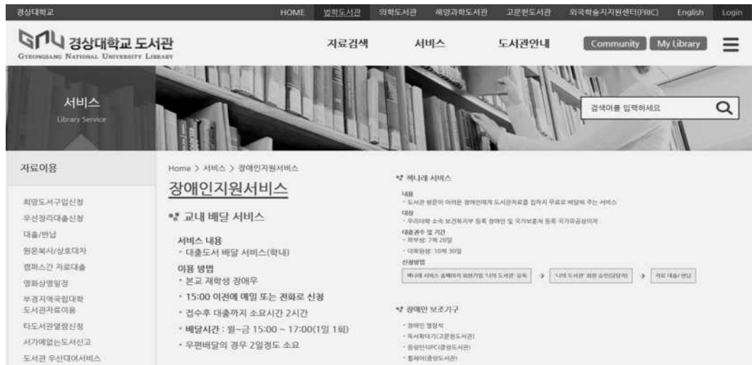
<그림 7> 경상대학교 도서관의 장애인지원서비스