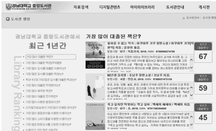
<그림 5> 경남대학교 중앙도서관 '도서관 랭킹' 서비스 (경남대학교 도서관 홈페이지)

독서 프로그램 이외에도 기초교양교육 지원으로 도서관 이용기록(대출, 독서경향 등) 및 학업정보(전공, 학년 등) 분석을 바탕으로 맞춤형 도서 추천서비스를 지원하는 과제가 제시되었다. 전국 대학도서관들은 도서관의 대출, 이용자, 장서 등의 수치화된 데이터를 활용하여 도서 추천 서비스 및 정보서비스에 활용하는 경향을 보이고 있다. <그림 5>는 경남대 도서관에서 도서 대출과 이용 현황을 분석하여 제공하는 랭킹 서비스이다.