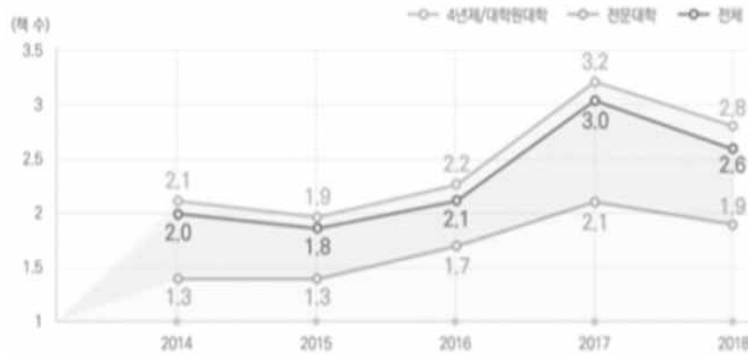
<그림 2> 2014~2018 전국 대학도서관의 재학생 1인당 연간증가 책수의 변화 (한국교육학술정보원 2018)

문이다. <그림 2>는 최근 5년간(2014~2018) 전국 대학도서관에서 재학생 1인당 연간 증가 책 수의 추이를 나타낸 것이다.