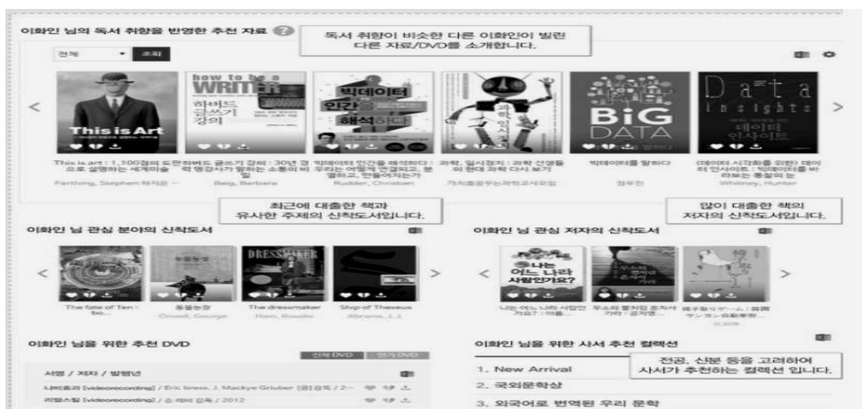
〈그림 6〉 이화여대 도서관의 독서프로파일링 서비스(이화여자대학교 도서관 블로그)

이화여대 도서관은 개인의 대출기록을 바탕으로 독서 취향을 분석하여 도서를 추천해주는 개인 맞춤형 추천서비스인 ‘독서프로파일링 서비스’를 확대한다. 또한 주제전담사서와 연계한