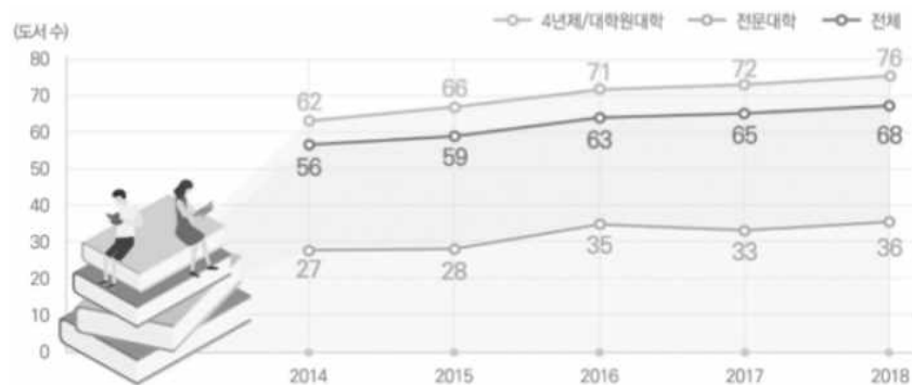
<그림 1> 2014~2018 전국 대학의 재학생 1인당 도서관 소장 도서수의 변화(한국교육학술정보원 2018)

<그림 1>은 최근 5년간(2014년~2018년) 재학생 1인당 도서관 소장 도서 수의 추이를 나타낸 것이다.