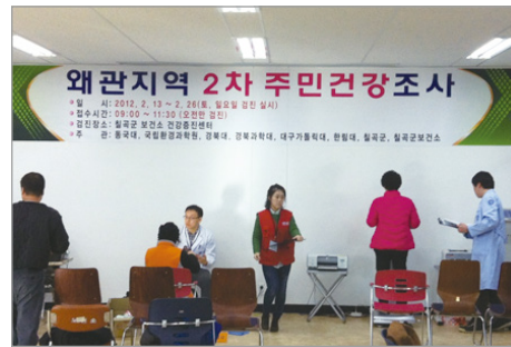
〈그림 4〉 칠곡군 보건소에서 실시한 2차 설문조사와 건강검진 현장

왜관 거주력 및 왜관 지하수 섭취력에 따른 의사 진단율 및 임상검사 결과는 차이가 없었고, 일부 유의한 차이가 있는 경우 노출력 증가에 따른 예방 효과를 보였지만 일률적인 경향성은 보이지 않았다. 조사 참여별로 보면 1차 설문조사만 참여한 사람들에게 비해 2차 설문조사 및 건강검진까지 모두 참여한 대상자의 의사 진단율이 높고, 특히 지하수 비섭취군의 질병이 있는 사람들이 섭취군에 비하여 더 많이 2차 설문조사 및 건강검진에 참여한 것으로 나타나, 1차 설문조사의 노출에 따른 유의한 차이가 2차 설문조사 및 건강검진에서는 감소한 것을 알 수 있다. 결과 해석에는 여러 가지의 다양한 가능성 및 제한점이 있지만, 의사 진단력에서는 왜관 지하수 섭취기간이나 거주력에 따른 차이는 거의 없었다.