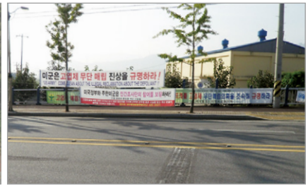
〈그림 2〉 고엽제 무단 매립 진상을 규명하라는 현수막들

캠프 캐럴 주변 환경조사에서 고엽제 드럼통을 매립하였다는 구체적인 증거는 없으나 지하수와 토양의 고엽제를 포함한 유해물질 측정 과정에서 기지 내 41구역에서 trichloroethylene(TCE)과 perchloroethylene(PCE)의 농도가 각각 0.002~2.744 mg/L, 0.114~9.592 mg/L 검출되었으며, 기지 외부의 지하수에서도 TCE와