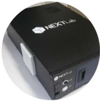
셋톱박스 상시 UX품질측정 계측기

“이미 제정되었거나 추진 중인 표준 기술을 시의적절하게 제품에 적용하면 독보적인 시장을 창출할 수 있을 것으로 예측합니다. 특히 IPTV 시장은 새로운 유료 방송 서비스의 한 축으로 국내뿐 아니라 해외에서도 활성화되기 시작했으므로 세계 시장으로의 동시적 접근도 쉽습니다.”