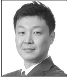
이 열 롯데케미칼 책임연구원

Q. 먼저 제29기 포장기술관리사 우수성적 수료자에 선정된 것을 축하드립니다. 소감 한 말씀 부탁드립니다.