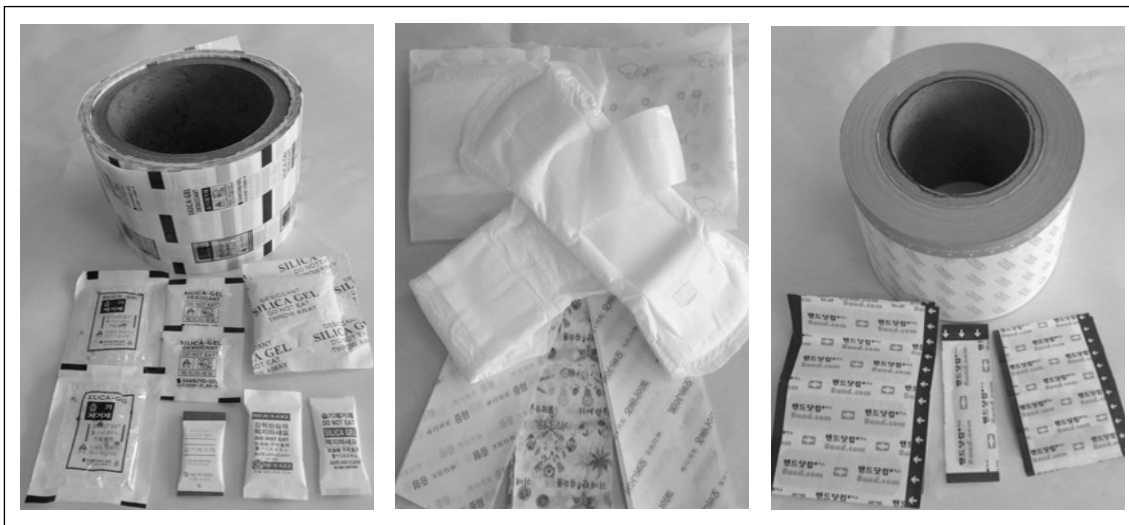
▲ (주)덕원에서 생산하는 제품 모습

(주)덕원은 생산 공정을 개선하고, 숙련된 종업원과 위생적인 생산 환경을 갖추기 위해 노력하