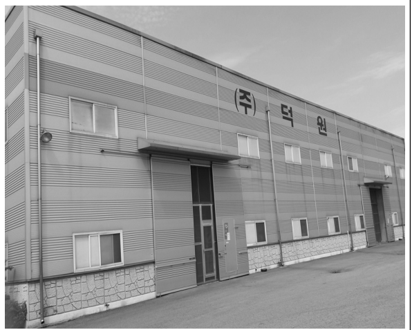
▲ (주)덕원의 사무실과 공장의 모습