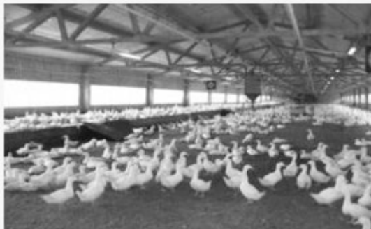
스핀 피더가 설치된 오리사육장은 사료의 원활한 분배와 균일도를 보장한다.

생후 21일까지의 체중 및 균일도 관리는 종오리의 산란기간 전반에 걸쳐 영향을 미치므로 체리벨리사는 1일 단위의 사료급여 체계를