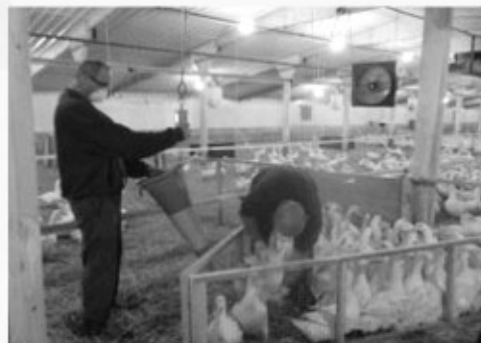
체리밸리사의 체중 측정 모습(울타리를 이용해 전자저울 깔때기 사용)

7일령까지는 최소 50수, 최대 150수의 오리의 체중을 한꺼번에 측정한다. 7일령부터 14일령까지는 10수 단위로 측정이 가능하지만 21일령 이후부터는 개체별로 개별 측정한다.