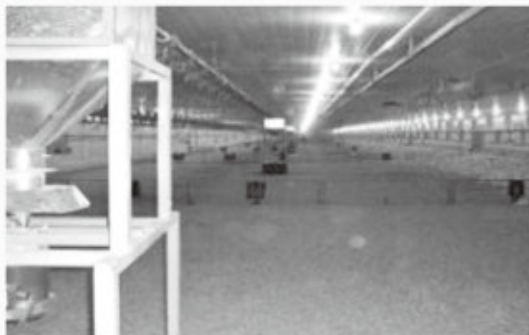
스핀 피더는 대략 750수당 1개꼴로 설치한다.

짜지 않고 설치와 작동이 용이하다. 많은 기자재 업체들은 완전 자동으로 사료량을 측정하고 분배하면서도 작동이 간편한 스피ن 피더 시스템을 제공한다. 제작사마다 원반의 모양은 상이하다. 저렴한 제품은 사료를 빠르고 균일하게 뿌려주는 대신에 종종 기계 주변에서 도넛 형태로 사료가 분배되지 않는 경우가 발생한다. 보다 정밀한 제품의 경우 기계 주변을 비롯하여 바닥까지 사료를 고르게 뿌려준다. 따라서 주요 스피ن 피더 제품들은 원반의 지름을 옵션으로 선택할 수 있다. 저렴한 제품의 경우 원반의 속도를 자동으로 조정할 수 있는 모터로 변경하면 효율을 높일 수 있다.