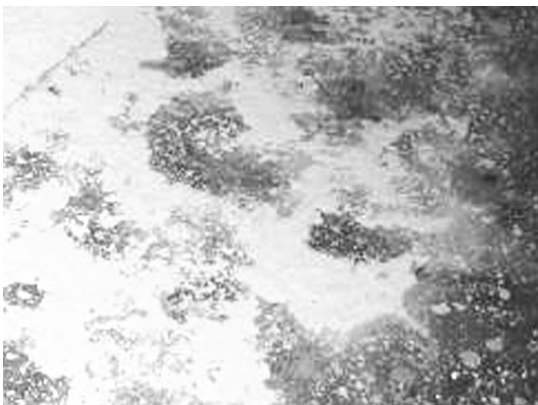
▲ 축사 바닥에 뿌려 놓은 살서제

살서제는 일시적으로만 축사 내에 적용하지 말고 농장 안에 쥐들이 완전히 없어질 때까지 적용하도록 한다. 설사 이후에 쥐들이 보이지 않는다고 하더라도 안심하지 말고 외부에서 쥐들이 계속 유입이 될 수 있으므로 살서제를 1개월에 한 번씩 점검하여 놓아두고 모니터링 하도록 한다. 베이트 스테이션 안에 효과적인 살서제를 넣어두고 쥐들이 잘 다니는 장소에 놓아두면 쥐들이 그 속에 들어가 다량의 살서제를 섭취하고 밖으로 나와 죽게 된다.