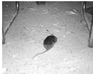
▲ 축사 주변을 배회하는 쥐