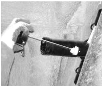
▲ 며칠 후 살서제가 없어진 것을 확인한 후 보충해 준다