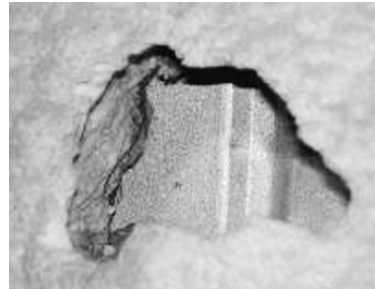
▲ 쥐가 뚫어 놓은 구멍들과 주변의 배설물들

에 13cm 정도 자란다. 이 자라나는 앞니를 마멸시키기 위해 농장의 시설을 다 갹아 놓게 된다. 농장의 전기 시설, 기자재를 파손시