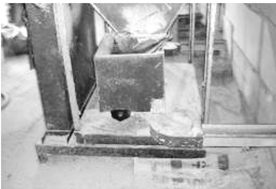
▲ 사료통 주변은 쥐들이 좋아하는 장소

쥐 1마리가 섭취하는 음식물은 자기 체중(300~500g)의 최대 1/3까지도 섭취를 한다고 한다. 규모가 제법 되는 농장에 1,000마리의 쥐가 농장에 서식하고 있다고 가정하