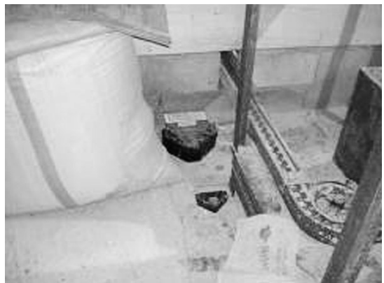
▲ 사료통 주변의 구서 대책