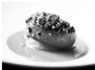
〈푸아그라(프랑스 오리 간 요리)〉