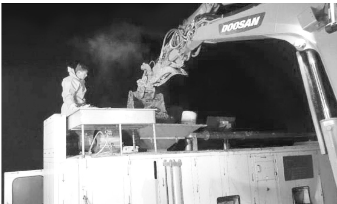
▲ 살처분 현장에서 폐사축 처리기가 유용하게 활용되고 있다.

다목적 처리기, 폐사축 처리기, 부화부산물 처리기가 양계업을 하면서 상시 필요한 기계지만 AI 발생이 잦은 겨울철에는 아무래도 이동식 폐사축 열처리기에 관심이 쏠릴 수밖에 없다. 이동식 폐사축 열처리기는 사체 상하차기와 발전기 등을 구비하여 장소에 구애를 받지 않고 전국 어디에서나 사용할 수 있다는 장점이 있다. 또한 동남테크의 열처리기는 전 과정이 계사와 농장 내에서 열처리가 이루어지기 때문에 AI 확산을 방지하는데 획기적이라 하겠다. 동남테크의 열처리기는 AI가 발생하면 농장으로 우선 이동하고 대규모 사체를 분쇄기를 통