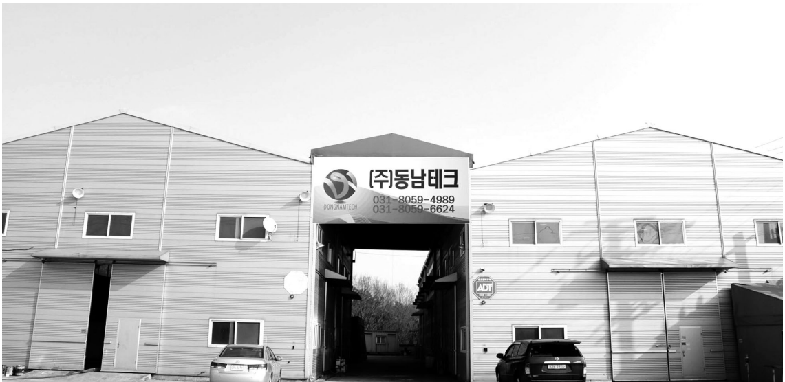
▲ 경기도 화성시 팔탄면에 위치한 동남테크 공장 전경(지난 12월 23일 확장 이전하였다.)