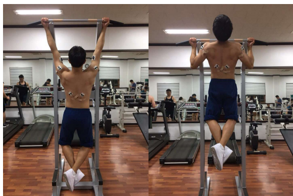
그림 1. Pull up Measuring posture