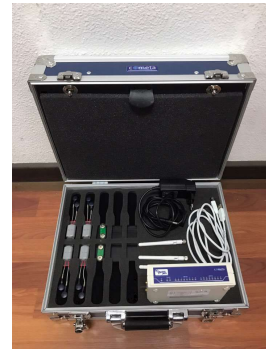
그림 5. wave plus EMG