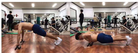
그림 2. push up Measuring posture