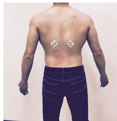
그림 4. EMG Pad attachment area