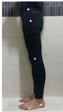
그림 2. Sponge-attached site for measuring the angle of the leg joint