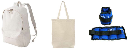
그림 1. Back pack, Eco bag, Sand bag