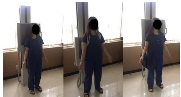
그림 5. Foot pressure measurement result