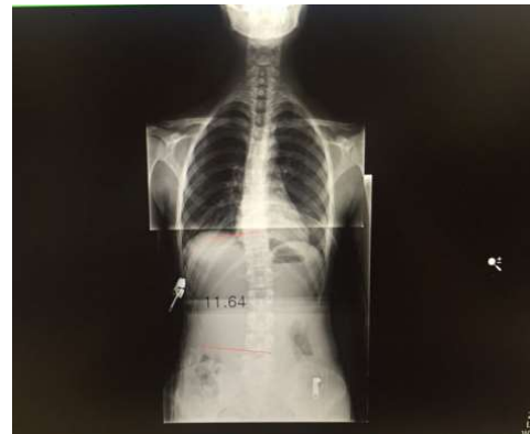
표 7. cobb's angle measurement result