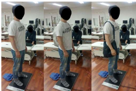
그림 4. Foot pressure measurement