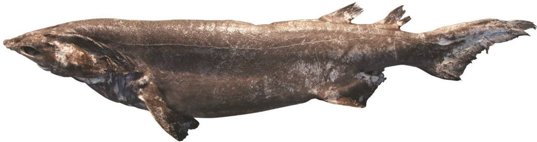
Fig. 1. Echinorhinus cookei , PKU 10380, female, 1,810 mm in total length, Busan, Korea.

몸은 짧고 단면이 원통형에 가깝다. 머리는 크고 주둥이는 상대적으로 짧다. 등쪽에서 보면 머리가 넓고 주둥이는 둥글다. 눈이 커서 안경이 전장의 2.0%에 달한다. 입의 폭은 전장의 11.5%로 매우 크다. 양턱에는 납작하고 가장자리가 매끈한 다침두의 이빨이 줄지어 나 있다(Fig. 2A). 분수공(spiracle)은 매