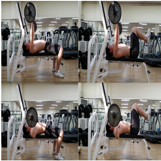
Fig. 2. Phase of action.