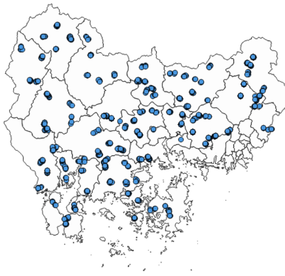
Fig. 1. Map of soil collection site in Gyeongnam province.