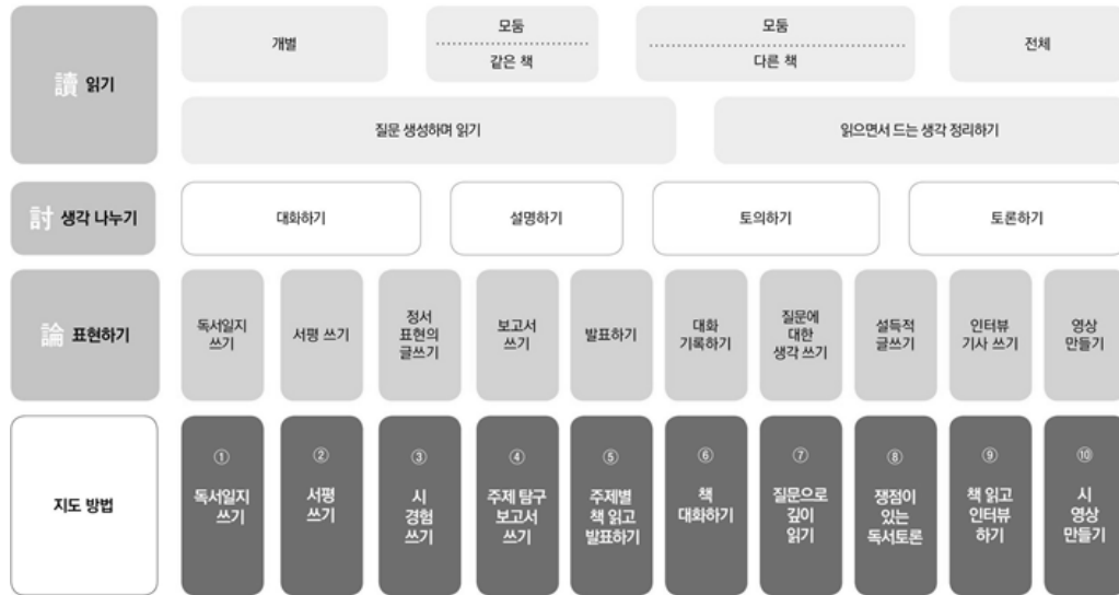
<그림 1> 讀·討·論 모형