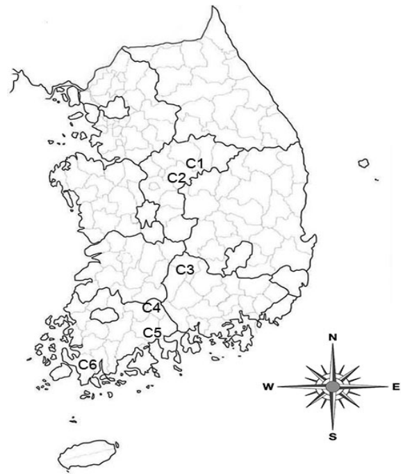
Fig. 1. Location map of investigated Cephalotaxus koreana habitats.

조사지의 해발고, 경사, 방위를 측정하고, 생육하고 있는 개비자나무의 수고와 직경을 조사하였다. 토양의 화학적 성분을 조사하기 위해 각 조사구 내에서 낙엽층을 제거한 후 토양을 채취하여 산도(pH)는 pH meter법, 유기물함량(O.M)과 전질소(T-N)는 건식산화법, 유효인산(Avail P2O5)은 Lancaster법, 양이온치환용량(CEC)은 1N-초산암모니움 침출법, 치환성 양이온(K + , Ca + , Mg 2+ )은 원자흡광광도법을 이용하여 분석하였다.