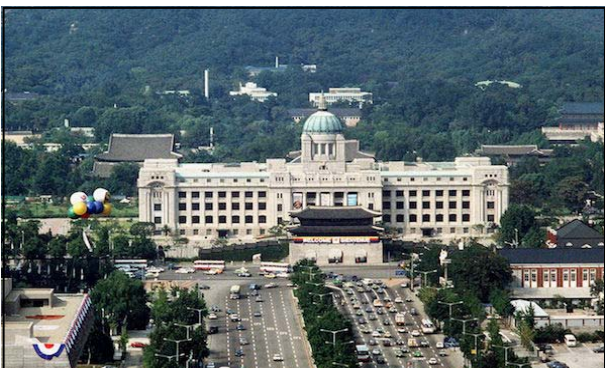
Figure 2. The front view of the old Japanese general government building(1988)