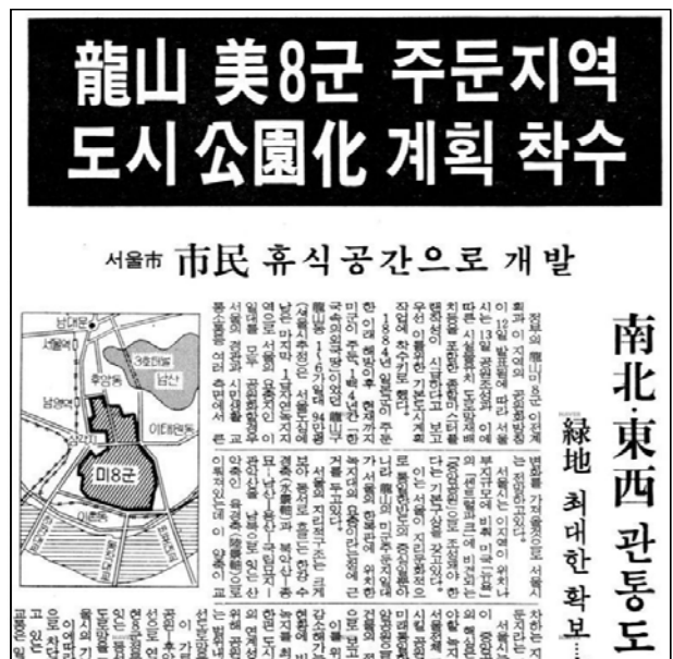
Figure 8. Plans for relocation of U.S. army and formation of an urban park(1988)

IV장은 크게 두 가지 내용으로 전개된다. 먼저, 근대 역사 경관을 형성하고 보존 혹은 철거를 결정하는 중요한 역할을 하는 상징적 가치 간의 대립 양상을 살펴본다. 특히 근대 역사 경관은 ‘상징적’ 경관으로서 조선시대의 역사와 한국 근대사, 건축과 경관, 민족주의와 쇼비니즘이라는 여러 상징적 가치 간의 대립 과정을 통해 형성되며, 이 과정에서 동시대 사람들이 보다 선호하고 중요하게 생각하는 기억은 곧 해당 경관의 상징적 가치가 된다. 다음으로 근대 역사 경관이 형성되는 과정에서 발생하는 문제점들을 보완하고, 여러 비판에 대응하는 기능