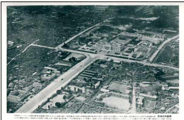
Figure 1. The new general government building in front of Gyeongbokgung Palace(1926)