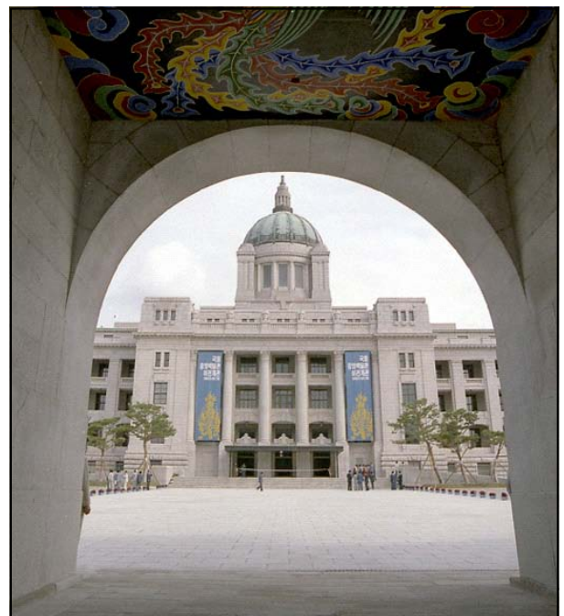
Figure 7. National Museum of Korea opens in the old Japanese general government building(1986)

새 박물관 건물을 건립하기 전에 조선총독부 건물의 철거부터 추진하는 소위 ‘선철거-후건립’의 줄속 추진 또한 비판의 대