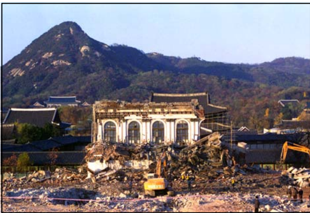
Figure 5. Gyeongbokgung Palace revealed by the demolition of the Japanese general government building(1996)

국립중앙박물관이 일본인의 관광 명소이자 기념사진 촬영지라는 점 또한 국민의 분노를 불러일으키는 요소였다. 관련 기사를 살펴보면, “일본인 관광객들이 총독부 건물을 찾아와 사진을 찍으며 흐뭇해하는 광경을 볼 때마다 가슴이 아프다”(Hankyoreh, 1990. 11. 6), “자신들의 조상이 한반도를 통치하면서 식민지 지배 관청으로 썼던 웅장한 그 건물을 배경으로 해서 흐뭇한 표정으로 사진을 담아가는 일본인들을 볼 때면 씁쓸한 생각이 절로 든다”(Dong-A Ilbo, 1991. 6. 16), “입장객 1백만 돌파 기념 입장객이 일본인이라는 것이 우연의 일치가 아