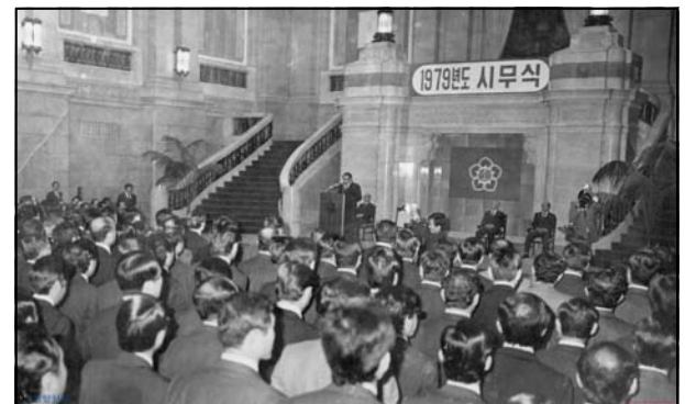
Figure 4. The parliamentary opening session on meeting room in Capital Hall(1979)