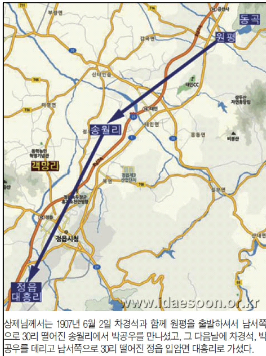
상제님께서는 1907년 6월 2일 차경석과 함께 원평을 출발하셔서 남서쪽으로 30리 떨어진 송월리에서 박공우를 만나셨고, 그 다음날에 차경석, 박공우를 데리고 남서쪽으로 30리 떨어진 정읍 입암면 대흥리로 가셨다.

그리고 대순진리회의 종교적 기억과 회상의 공간으로 한정할 수 없다. 그 길은 내적 의미를 추구하고 변화와 개인적 성장을 희망하는 모든 사람들을 위한 정신의 이동 통로이어야 한다. 이를 위해서는 성지의 개념을 새롭게 정의하거나 분류할 필요가 있으며, 순례는 차를 타고 목적지에 내려 성스러운 대상을 둘러보는 편안한 관광이 아니라 77) 걷는 동안 이루어지는 심고의 시간이라는 순례의 제의적 성격을 기억해야 할 것이다.