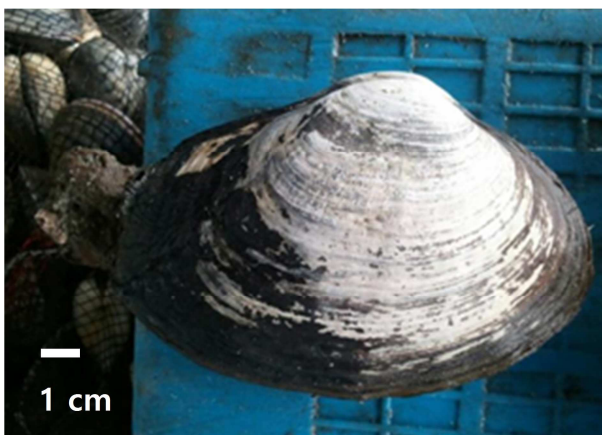
Fig. 1. The photography of parent shellfish of Tresus keenae .