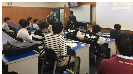
Fig. 1. Introductory engineering course “Techne Odyssey”