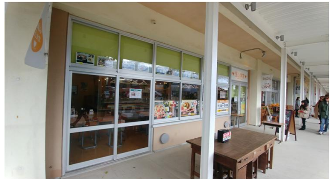
사진 14. 교사동 1층 레스토랑

호타초등학교 주차장을 중심으로 왼편 교사동을 리모델링하여 1층 종합안내소, 레스토랑, 카페 등을 운영하고 있으며 2층 갤러리 및 숙박시설을 운영하고 있다. 1층 안내소, 레스토랑, 카페 등은 기존 학교시설에 있던 가구 및 소품을 활용하여 휴게소에서 옛 학교의 모습을 느낄 수 있도록 하였다.