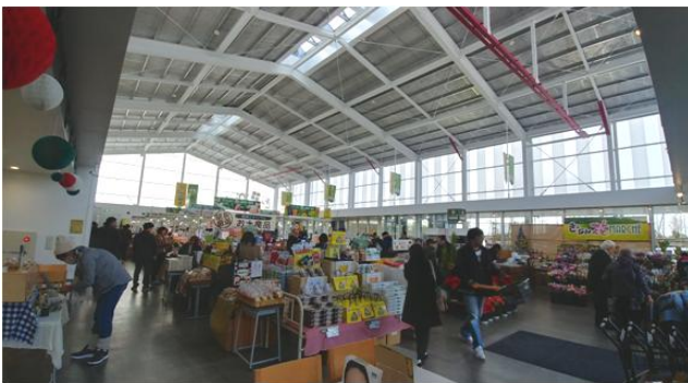
사진 18. 교난마켓(체육관 리모델링) 내부