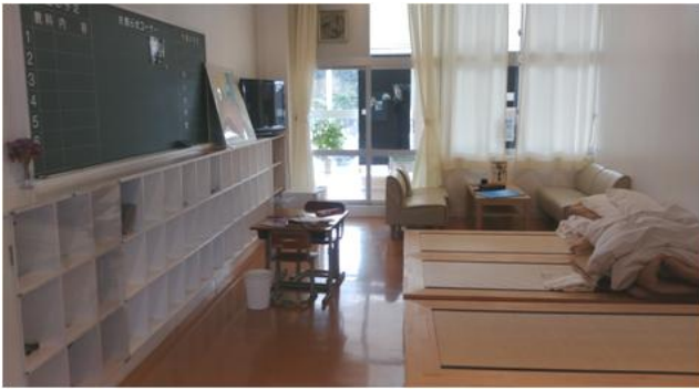
사진 16. 교사동 2층 숙박시설 내부(4인실)

휴게소의 주차장 중심으로 오른쪽에는 체육관을 리모델링한 교난마켓(鋸南市場)이 있으며, 교난마켓에서는 지역 기념품 및 마을주민이 수확한 농수산물로 채워진 직매장으로 사용하고 있어 지역의 주요 관광거점 및 지역민의 주요 수입원으로써의 큰 역할을 하고 있다.