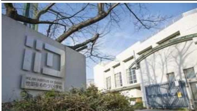
사진 1. 세타가야모노즈쿠리학교 외관

일본 세타가야구에 있는 모노즈쿠리학교 소개에 앞서 ‘모노즈쿠리(ものづくり)’라는 일본어 뜻을 한국어로 번역해보면 최고의 제품을 만들기 위해 심혈을 기울이는 자세로, 일본 사회의 장인정신을 의미하는 것으로 모노즈쿠리학교는 장인정신을 이어가는 학교라고 할 수 있다.