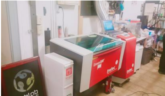
사진 4. 디자인 지원 공간(3D프린터 및 기자재 공동활용)

아래는 창업지원 전용 업무공간을 대여한 입주사들에게 지원하는 공간으로 수공예품, 가구제작과 관련된 입주사들 공동으로 사용할 수 있는 각종 기자재들이 구비되어 있는 디자인 지원공간이다.