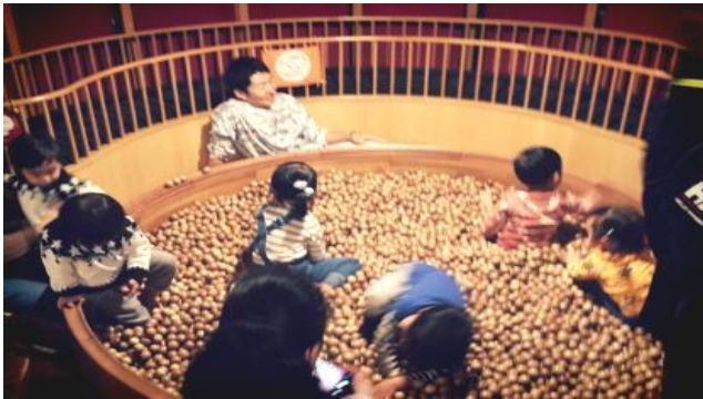
사진 8. 유아 놀이 공간

장난감 미술관은 편백나무를 등을 사용한 친환경 장난감이 대부분이며, 주민참여와 신주쿠구 등 지자체의 후원과 NGO의 협력을 받아 운영되고 있다. 후원자에 대한 감사의 의미로 도쿄 장난감 미술관 로비 벽에 있는 현판 주위에 후원자 이름을 새긴 나무 블럭을 쌓아 진열하였다.