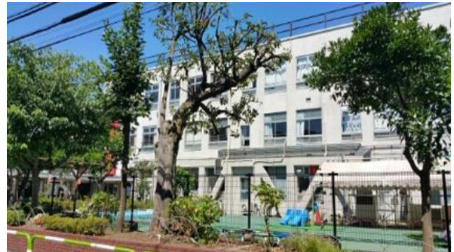
사진 6. 도쿄 장난감 미술관 외관

신주쿠에 위치한 도쿄 장난감 미술관은 1984년 도쿄 나카노에 있는 예술 교육 연구소의 부속 기관으로 ‘보고, 만지고, 빌려서 논다’는 세 가지 기능을 가진 장난감 박물관을 개관하고, 2008년 폐교된 요즈야 4초등학교로 이전 개관하였다. 요즈야 4초등학교는 신주쿠 도심지에 1907년 개교해 100여년 역사를 가진 학교로 도심공동화 현상으로 2007년 폐교되자, 주민들에 의해 학교를 역사적 건물로 보존하고자 협의회 구성하고 폐교를 활용하고자 하였다. 폐교를 활용한 장난감 미술관 설립을 위해 「모금 광장」을 통한 기부금 및 「장난감 큐레이터」 활동을 통한 시간 기부에 의하여 개관되었다.