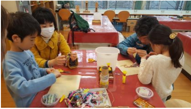
사진 7. 장난감 만들기 체험공간