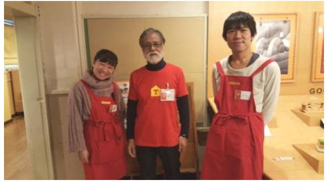
사진 10. 시니어 자원봉사자와 장난감 큐레이터

도쿄장난감 미술관은 장난감 체험과 큐레이터 양성과정을 병행하여 운영하고, 큐레이터의 경우 자격증을 부여하고 있다. 특히, 지난 25년 간 장난감 큐레이터를 4천 명 정도 양성하였으며, 큐레이터 중 노인빈도가 높아 아이, 어른, 노인 등 세대 간 화합이 되도록 하고 있다.