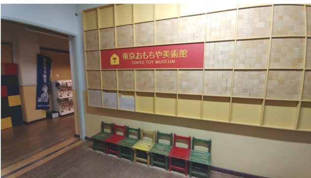
사진 9. 도쿄장난감미술관 로비에 있는 후원자 현판

장난감 미술관은 편백나무를 등을 사용한 친환경 장난감이 대부분이며, 주민참여와 신주쿠구 등 지자체의 후원과 NGO의 협력을 받아 운영되고 있다. 후원자에 대한 감사의 의미로 도쿄 장난감 미술관 로비 벽에 있는 현판 주위에 후원자 이름을 새긴 나무 블럭을 쌓아 진열하였다.