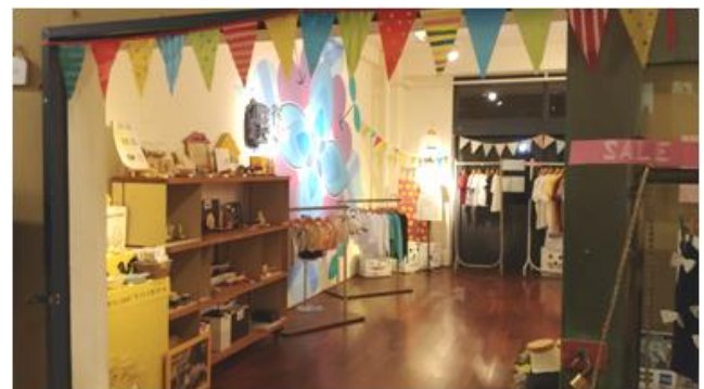
사진 2. 창업자를 위한 오피스 대여(수공예품 및 의류 판매장)

창업지원의 경우는 전용 업무공간을 제공하거나, 입주자간 혹은 지역민간의 교류를 위한 강좌 및 세미나를 실시하기 위해 하루나 단기로 비어있는 공간을 대여하고 있다. 시설의 내부를 살펴보면 교실과 복도를 리모델링하여 창업자를 위한 공간 및 전시공간으로 활용하고 있으며 대여 공간은 ‘Office(31~63㎡)’, ‘Business support Booth(9㎡)’, ‘Coworking Space(테스크 1석)’ 총 3가지 유형으로 나뉘며 유형에 따라 보증금 및 임대료를 산정하고 있다.