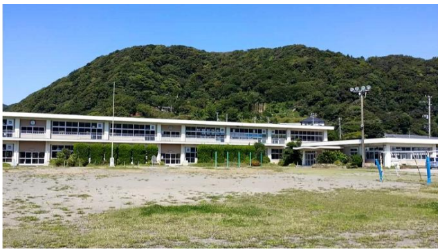
사진 12. 폐교되기 전 호타초등학교 전경

호타초등학교 폐교시설은 지역의 중심적인 역할과 함께 도로를 통한 지역 연계가 촉진되는 등 다양한 효과도 기대할 수 있도록 계획되었다. 이러한 배경으로, 휴게기능, 정보발신기능, 지역연계기능의 3개 기능을 함께 가진 휴게시설인 미치노에키 1) 가 계획하게 되었다. 일본에서 휴게소는 기본적으로 차량 운전자가 무료로 이용가능한 주차장, 화장실과 각종 도로 및 지역정보 제공을 위한 시설, 기타 다양한 서비스 시설 등을 갖춘 도로변 휴게공간이다. 이에 미치노에키는 각 지역 고유의 축제 및 다양한 이벤트를 개최하고 있으며 특산물 판매도 이루어지고 있어 지역진흥 및 교류거점의 역할을 수행하고 있다.