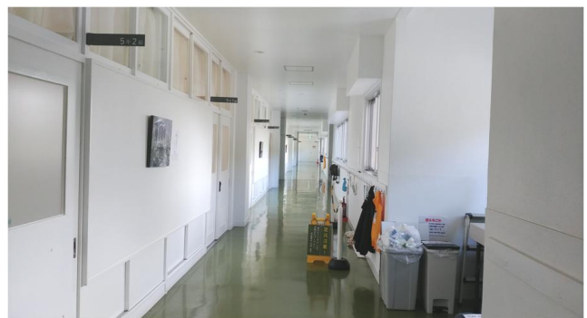
사진 15. 교사동 2층 숙박시설 복도

교사동 2층 숙박시설의 경우 부모와 자녀가 추억을 공유하는 공간으로 설정하고, 호타초등학교의 교실을 일부 보존하면서 리모델링하여 이용객들에게 인기 있는 공간이 되었다. 아래의 사진은 교사동 2층 숙박시설의 복도로 학교의 복도 공간을 느끼며 객실인 교실로 들어갈 수 있게 디자인 되었다.