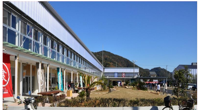
사진 11. 치바미치노에키호타초등학교 전경

치바현에 위치한 호타초등학교는 1888년도에 개교하여 1967년에는 636명의 학생이 재학하고 있었으나 2014년에 학생이 75명까지 줄어들어 폐교되었다.