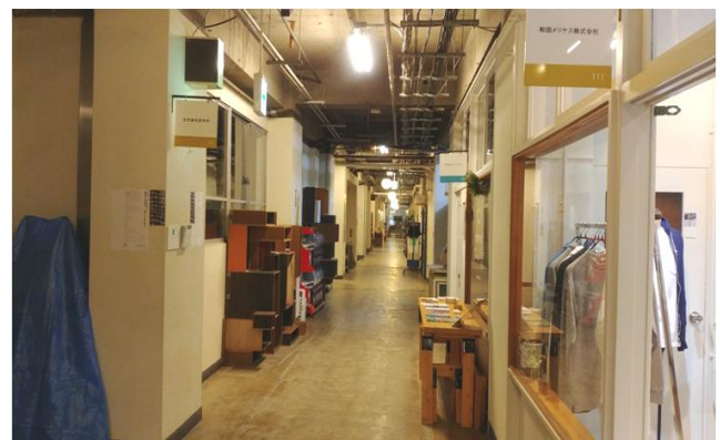
사진 3. 전시공간으로 활용하고 있는 교실 앞 복도