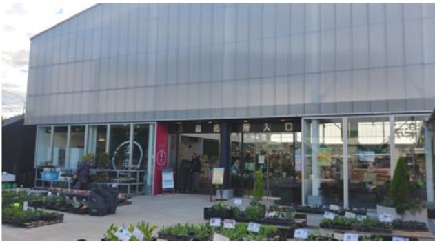
사진 17. 교난마켓(체육관 리모델링) 외부

휴게소의 주차장 중심으로 오른쪽에는 체육관을 리모델링한 교난마켓(鋸南市場)이 있으며, 교난마켓에서는 지역 기념품 및 마을주민이 수확한 농수산물로 채워진 직매장으로 사용하고 있어 지역의 주요 관광거점 및 지역민의 주요 수입원으로써의 큰 역할을 하고 있다.