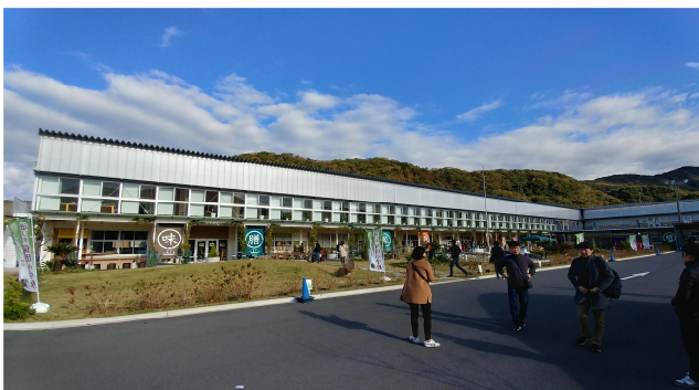
사진 13. 휴게소(미치노에키)로 리모델링된 호타초등학교

휴게소 호타초등학교는 이전 학교 이름을 그대로 사용하고 농림수산물의 판매, 지역 음식의 제공뿐만 아니라 관광, 이주 체험 등 다채로운 정보를 제공하고 도시와 농산 어촌의 교류 활성화 거점으로 활용하는데 목적을 가지고 있다. 주요 시설로는 갤러리, 레스토랑, 지역 특산물 판매