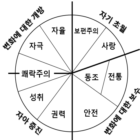
〈그림 2〉 Schwartz(1992)가치이론의 가치구조(한글번역임)