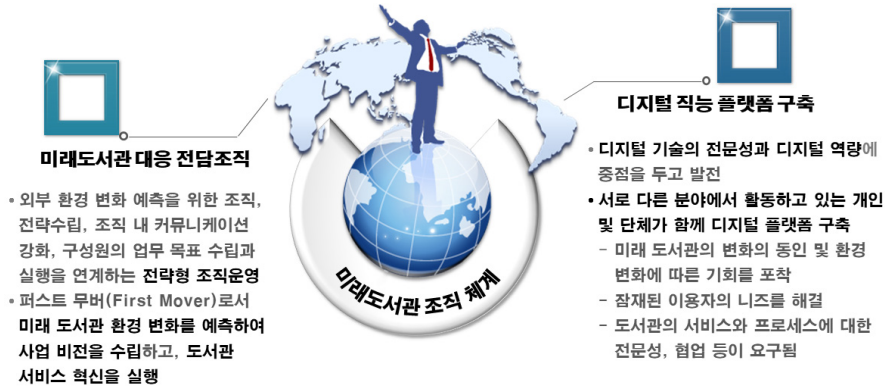
〈그림 3〉 미래 도서관 조직 체계(안)

주하지 않고 민첩하게 새로운 가치를 창조할 수 있는 미래지향적인 조직역량을 갖추어야 한다. 이를 위해서는 명확한 목표를 공유하고, 상호 신뢰와 진실성 있는 소통이 이뤄지는 협업 역량이 요구된다. 그 외에도 미래 도서관이 디지털 변혁에 성공하기 위해서는 리더십 역량과 디지털 역량 등도 필요하다. 이를 정리하면 〈표 4〉와 같다.