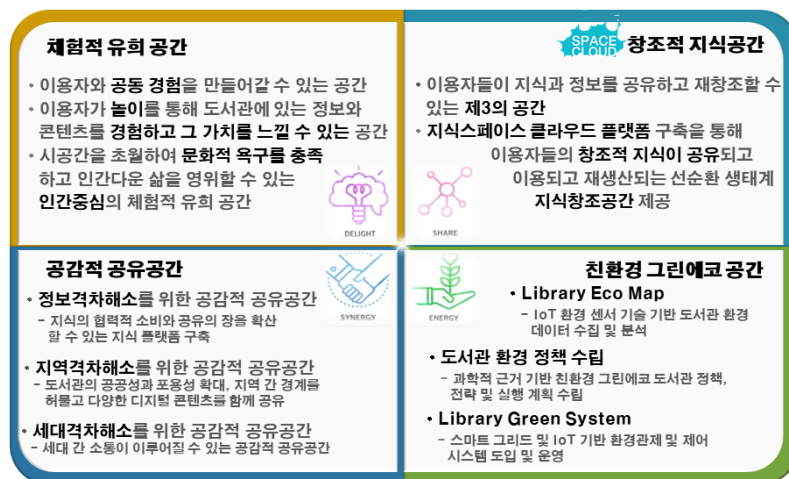
〈그림 4〉 미래 도서관의 공간(안)

개인화 서비스를 제공하기 위해 도서관별, 이용자별 데이터를 수집, 저장 및 분석에 관한 전략을 세울 필요가 있다. 예컨대, 사물인터넷 기술, 환경 센서, 비콘 시스템, 스마트 북카드 등의 ICBMS 기반 기술을 활용하면 세밀하고 다양한 이용자들의 패턴 정보를 수집할 수 있다. 또한 각 도서관 별로 대출 및 반납 기록, 방문, 열람실 이용, IT서비스 이용(무선랜 및 비콘 접속, 전원 사용, 인터넷 접속 등), 실내 환경 상태 등의 도서관 이용 데이터와 도서관에서 생성되지 않지만 도서관 이용에 영향을 줄 수 있는 기상, 달력, 지역별 발전 계획, 뉴스, SNS 등의 외부 환경 데이터를 직접 수집하거나 제공받을 수 있는 시스템이 구축되어 있어