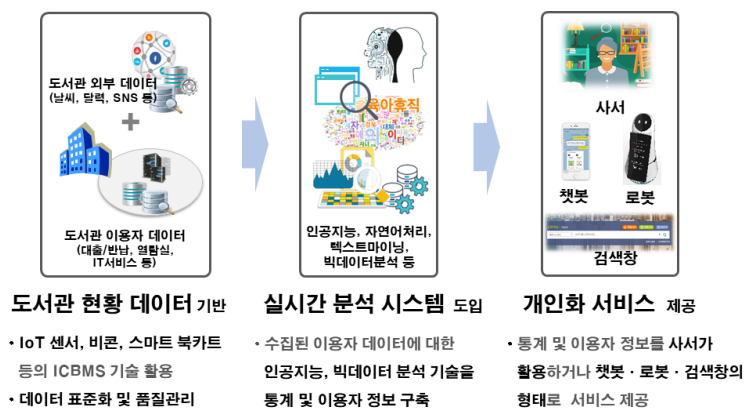
〈그림 5〉 개인화 서비스 제공방안

로 진행되고 있는 체험형 동화구연은 어린이들의 실제 모습이 동화 속에 투영되는 것으로 증강현실 기술을 활용한 문화체험 서비스의 일종이다. 이러한 증강현실 기술은 교육 혁명으로 바라볼 정도로 교육 콘텐츠에 큰 강점을 가지고 있다. 책을 펼치고 휴대폰에서 증강현실 앱을 실행시키고, 책을 휴대폰 카메라로 촬영하면 해당 콘텐츠와 관련되어 있는 영상 및 이야기들이 휴대폰에서 다양한 형식으로 재생되어 보여 줄 수 있다. 이렇듯, 도서관에서는 지속적으로 가상현실 및 증강현실에 대한 다양한 콘텐츠들을 지속적으로 모니터링하고 도입해야 하며, 이를 기획 및 추진하기 위한 인력과 행정 자원을 보강해야 한다. 그 외에도 장서의 디지털화가 진행되어 다양한 전자책이 출판되면서 도서관 밖에서도 실물 장서가 아닌 파일 또는 스트리밍 형태로 대출하여 책 뿐 아니라 음악, 동영상 등 멀티미디어까지 열람 및 감상할 수 있게 되어 또 다른 도서관의 경계가 없어지고 있다. 따라서 도서관은 이러한 디지털 콘텐츠에 대한 상호대차서비스를 추진하는 것도 고려해볼만한 일이다(〈그림 5〉 참조).